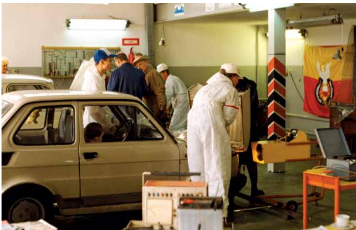
Praca w ramach akcji „Światło”.

Pozyskanie funduszy odbywało się poprzez odpłatne udostępnienie części terenu szkole nauki jazdy kartem, motorowerem, komisowi samochodowemu, przechowalni kolejki turystycznej itd. Uzyskane z tego tytułu wpływy finansowe pozwoliły na pokrycie wszystkich wydatków, a nadwyżka zasilila fundusze klubu. Dalsze starania kierownika MMRD umożliwiły jego nieodpłatne zmodernizowanie – postawiono nowe ogrodzenie wraz z podmurówką i dwiema bramami, położono nowy asfalt i wymalowano znaki poziome oraz postawiono 75 pionowych znaków drogowych, co umożliwiło uzyskanie pól manewrowych do przeprowadzania egzaminów praktycznych zgodnie z obowiązującymi przepisami. Ustawiono (z podłączeniem do sieci elektrycznej) dwa wycofane z ruchu autokary, które spełniały rolę sali wykładowej i szatni dla dzieci, uzyskano sprzęt audio-wizualny z materiałami szkoleniowymi. Z własnych wpływów